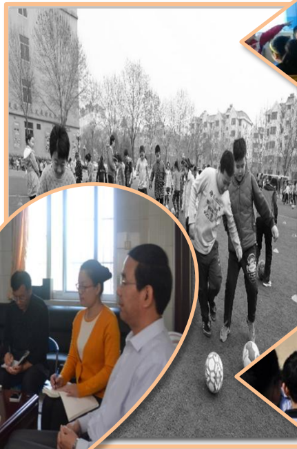
开展校园足球活动