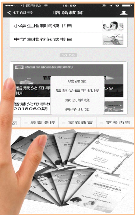
扎实做好家庭教育