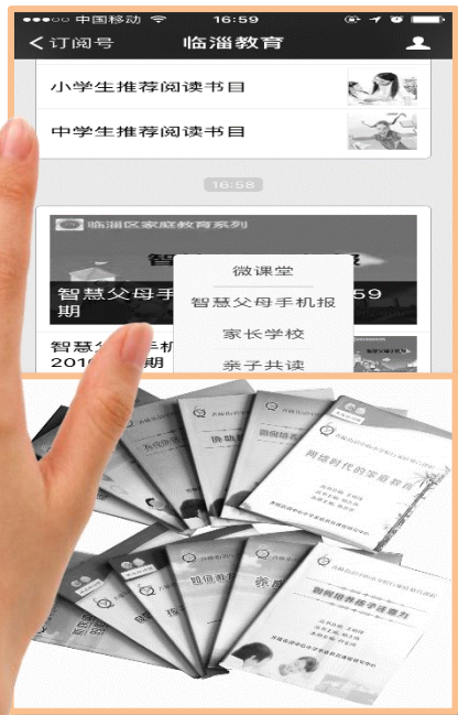
扎实做好家庭教育