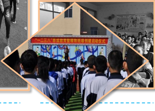
开展社会实践活动