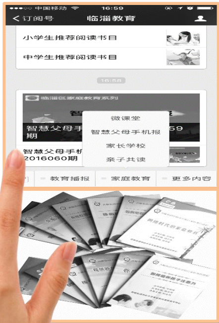
扎实做好家庭教育